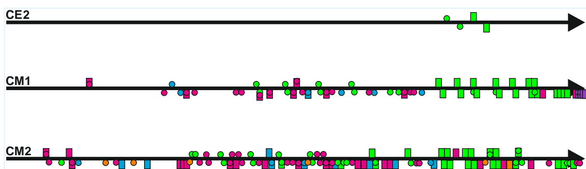
Figure 3. Planification des pages avec fraction ou écriture à virgule

Lecture : pour la partie supérieure de la frise, pages des parties « Je découvre » et « Je retiens » ; pour la partie inférieure de la frise, pages de la partie « J'agis ».