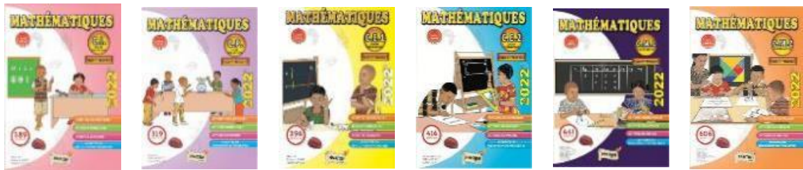
Figure 2. Pages de couverture suivant les années (manuels Didactikos)

Chaque double-page débute par un titre et un sous-titre mentionnant le palier (Palier X, avec X variant de 1 à 6 selon les étapes), l'objectif d'apprentissage (O.A.) et l'objectif spécifique (O.S.). Certains éléments, tels que les paliers, font directement écho à « l'approche par compétences » structurant le CEB ; celle-ci est revendiquée clairement par les auteurs des six manuels, à la fois dans les avant-propos des manuels et dans les guides d'utilisation. Hormis ces titres et sous-titres, et à l'exception des doubles-pages d'activités numériques qui comportent une tâche ritualisée de calcul mental ainsi que de celles dédiées à l'évaluation et à l'intégration interdisciplinaire, il apparaît très lisiblement que chaque double-page est structurée en quatre rubriques : « Je découvre », « Je réfléchis », « Je retiens », « J'agis ». Ces dernières pourraient, à première vue, faire penser au dispositif didactique « problème – compréhension – application » (Rey, 2001), où les élèves, à partir d'une action (au sens de « manipulation d'objets » matériels mais aussi conceptuels), sont amenés à résoudre un problème avant que ne soit exposé le savoir à retenir et ne soient proposées des tâches de réinvestissement. Or, rien à ce stade de l'étude ne nous a permis d'affirmer qu'il s'agissait effectivement de ce dispositif, d'où la nécessité de procéder à des analyses « locales ».